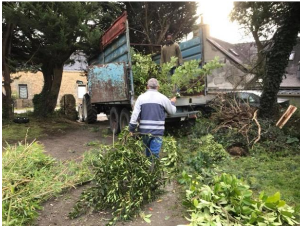
Journée d'entretien du nouveau siège social avec l'aide des bénévoles le 17 décembre 2017