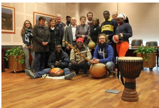
Accueil par le Maire de Theix

Ce bilan a pour but de recenser et d'analyser brièvement les interventions que nous avons animées. C'est aussi l'occasion de revenir sur le séjour en lui-même, la vie du groupe et celle de l'association pendant cette période.